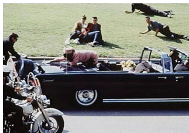
Una scena del documentario sul Presidente JFK