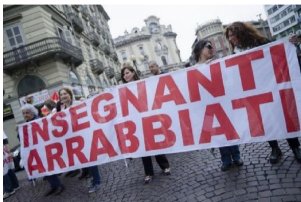
Bambini, genitori e insegnanti sono scesi in strada per protestare contro la chiusura delle scuole, in tutta la Campania

Noi studenti speriamo che questo accada presto per poter ritornare tra i nostri banchi.