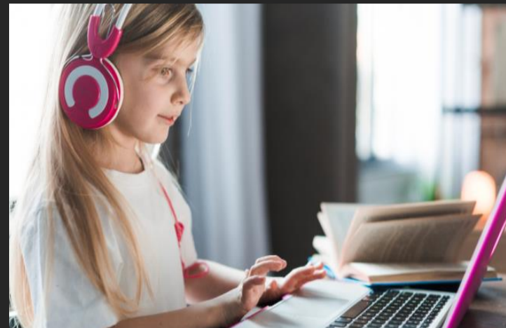
Il monitor, la nuova classe

Vincenzo De Luca, il presidente della regione Campania, ha chiuso le scuole il 16/10/2020 per evitare assembramenti sui pullman e altri mezzi pubblici per diminuire il contagio da covid. È partita la DDI, ovvero la didattica a distanza. Le scuole nelle altre