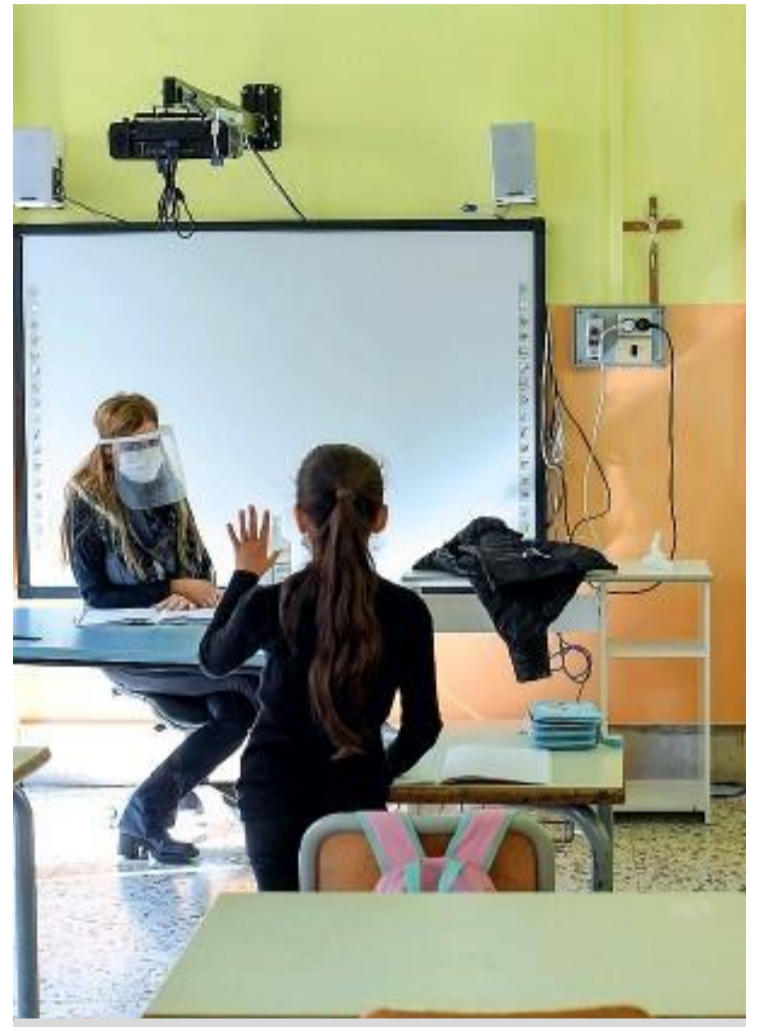
La classe, luogo di insegnamento e distanziamento

Francè, è difficilissimo! Anche se ci sono molte persone pratiche e svelte nel loro lavoro, ed ognuno svolge il suo compito in un modo preciso ed efficiente, la nostra scuola è difficile da gestire. Sono molto grata a tutti i miei collaboratori e alle maestre perchè lavorano tanto per il bene di ogni bambino e di tutta la scuola