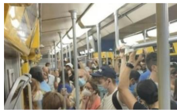
Folla nella metro

tutto ciò obbliga le persone ad uscire di casa molte ore prima e a fare rientro a casa molto più tardi.